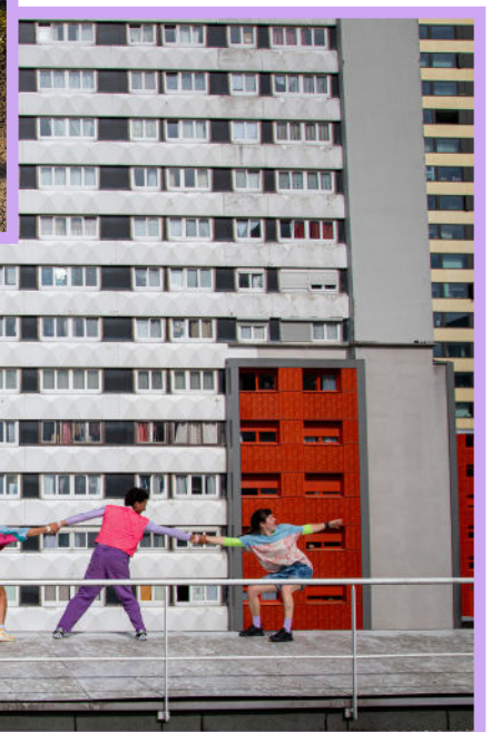
→ la horde dans les pavés